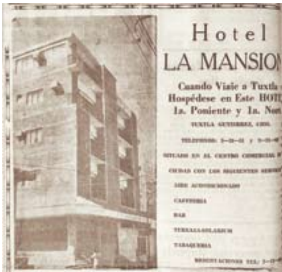
Publicidad original del Hotel La Mansión.