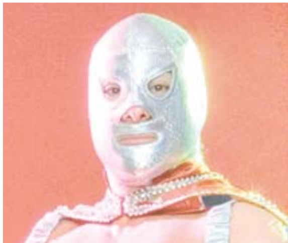
Santo, el enmascarado de plata. Cortesía

Uno de los más grandes ídolos de la lucha libre mexicana arribó a la capital chiapaneca para deleitar con sus llaves a chicos y grandes