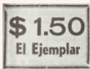
Costaba el periódico