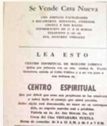
El "Centro Espiritual de Madame Lorena" deja un testimonio de los servicios esotéricos en la ciudad.