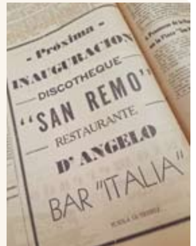
Inauguración de la Discotheque San Remo, el D'Angelo y Bar Italia. CP/AHE