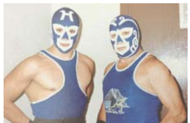
Huracán Ramírez, uno de los luchadores más queridos de México.

La lucha libre ha sido un deporte muy concurrido por la sociedad capitalina.