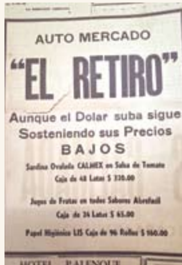
Anuncio del automercado El Retiro.