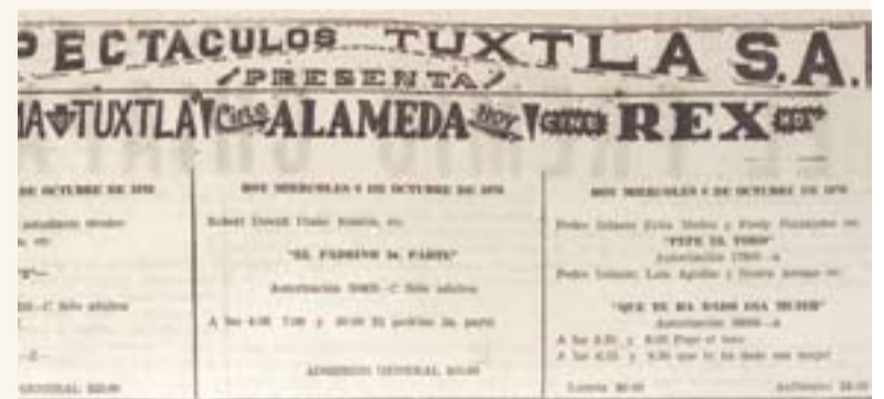
Cartelera cinematográfica que se publicaba en el Cuarto Poder. CP/AHE

El "Centro Espiritual de Madame Lorena" deja entrever algo de las creencias, así como la oferta de servicios esotéricos para resolver problemas de amor, salud y dinero, una práctica que sigue vigente. ◀